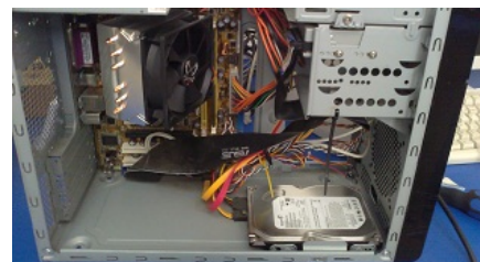
vnitřní část PC po vyčištění

Jak vypadá vnitřek počítačů ve vaší lékárně? Jako na prvním obrázku? ☺ Nebo druhém? ☹