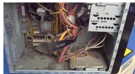
vnitřní část PC před vyčištěním

Pracovníci hardwarového oddělení společnosti Apatyka servis zajišťují vedle instalace počítačových sítí u nových zákazníků právě čištění a profylaktickou údržbu pro naše stávající klienty. Výsledek jejich práce je dobře patrný i z následujících dvou miniobrázků.