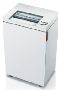
IDEAL 2445 MC